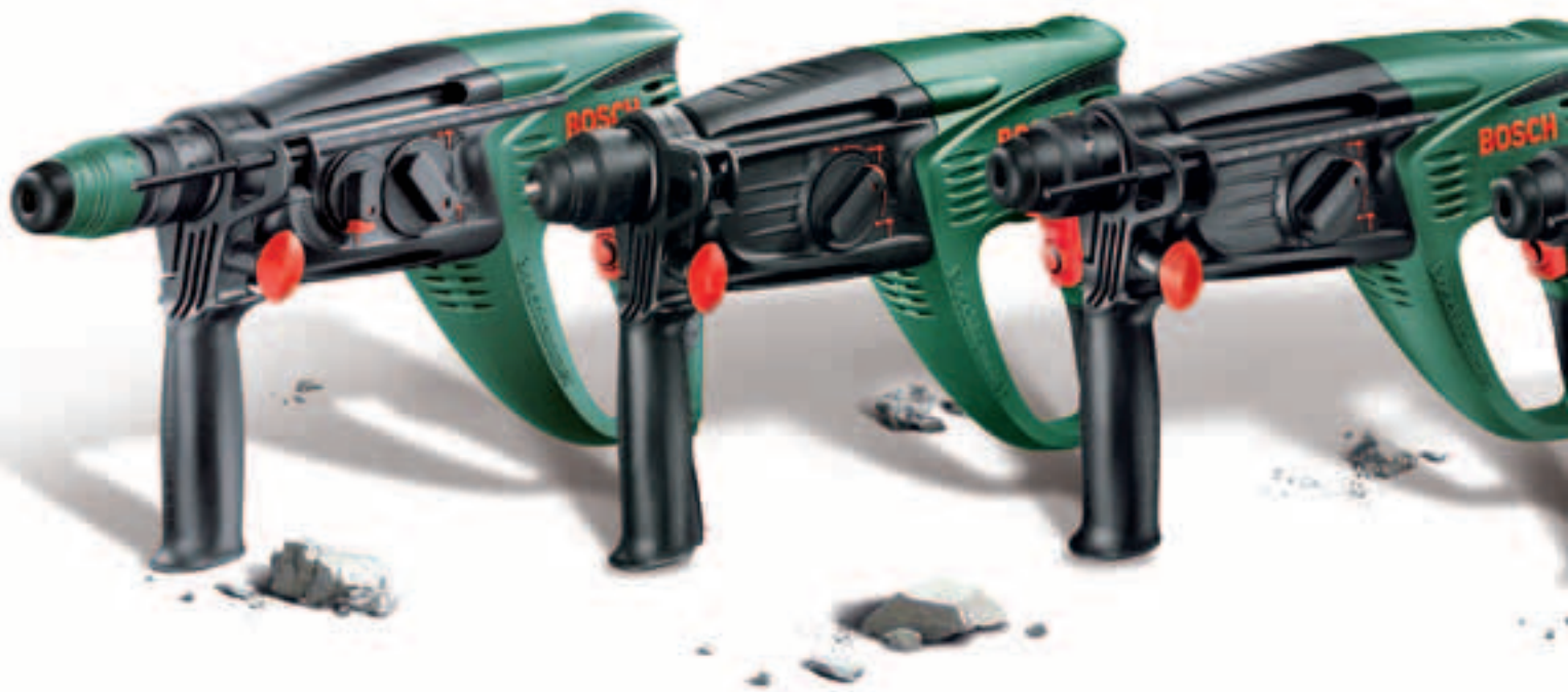
PBH 2900 FRE Bosch