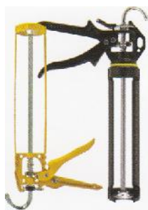
Pistol silicon cartus

Art nr: 111072 galben Art nr: 106617 negru