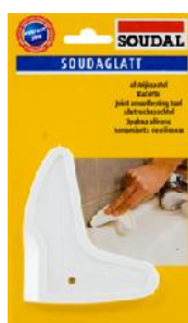
Spatula finisat izolanti